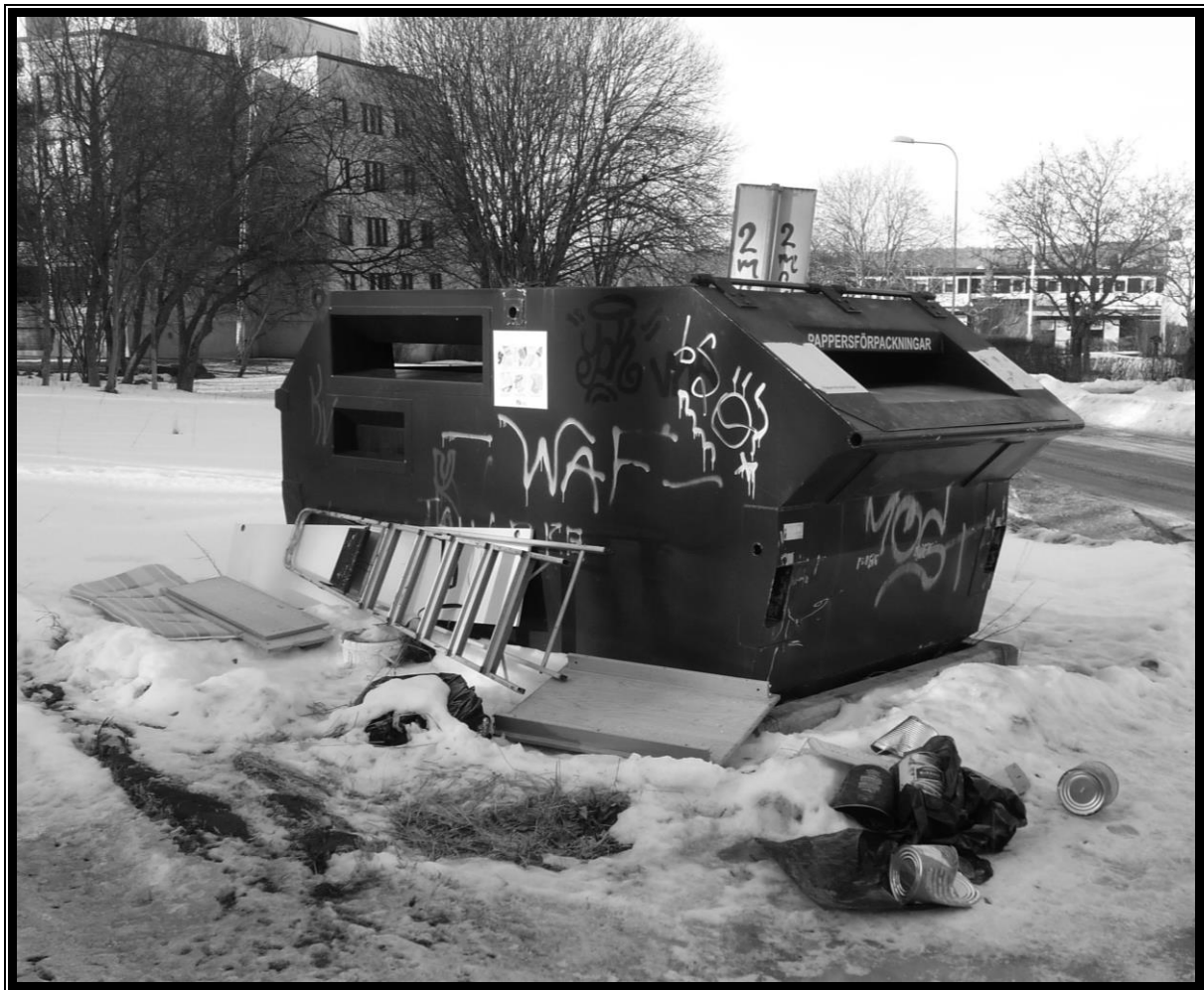
En tråkig syn vid infarten till en av parkeringsplatserna utefter Bandverksgatan i början av mars 2013.

Styrelsen kan bara konstatera att det ser stökigt ut. De flesta som bor i området vill antagligen inte att detta ska vara det första man ser när man kommer till området. Det är tråkigt att någon tycker att det är okej att bara dumpa sitt skräp på detta sätt. Skärpning! Det finns ett återbruk inte alls långt ifrån området. Lämna skräpet där, eller behåll det hemma.